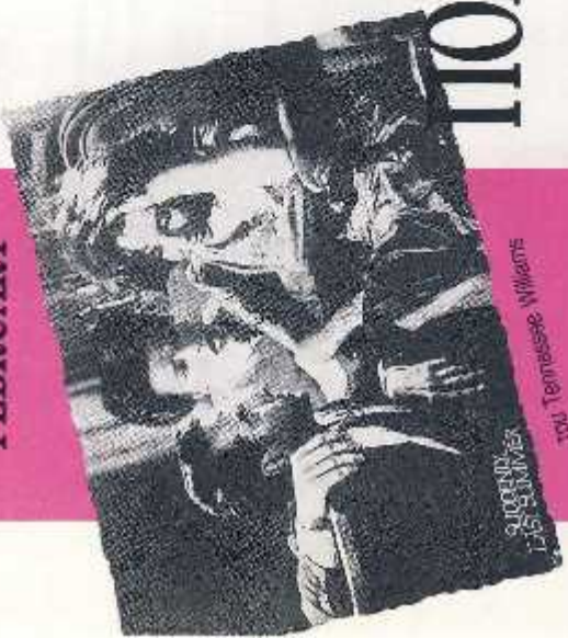
του Tennessee Williams